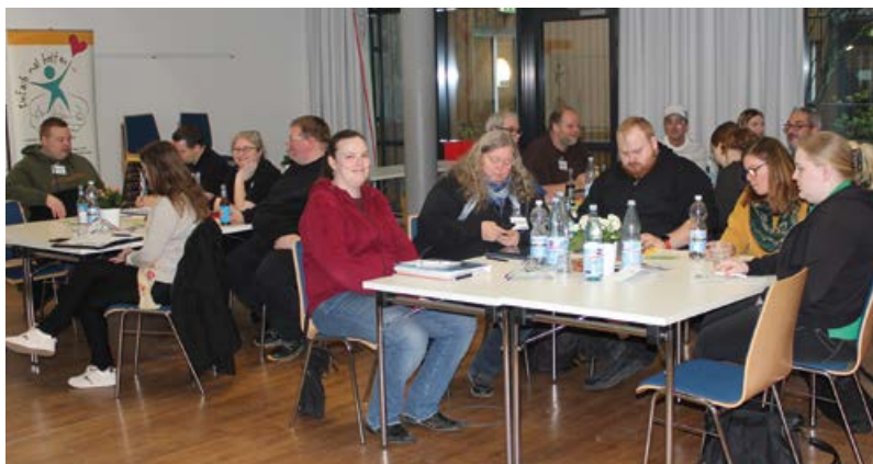
Bild: Die Ratssitzung fand in der Jugendbildungsstät- te Rolleferberg in Aachen-Brand statt.