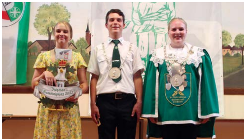
Die Diözesanmajestäten bei der Siegerehrung am Diözesanjungschützentag 2022 in Golzheim

Alle, die diese Ausgabe des Jungschützenechos erhalten und Geschwister oder jüngere Kinder in der Gruppe haben, sollen ruhig mal versuchen ihnen das Schützenwesen näher zu bringen, falls nicht schon längst getan. Denn vielleicht werden sie es auch mal ganz groß raus bringen!