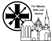
Bild: Die Wallfahrt der Oberbeberischer Schützen wurde durch das Corona-Sonderprogramm des BHDS Aachen unterstützt.