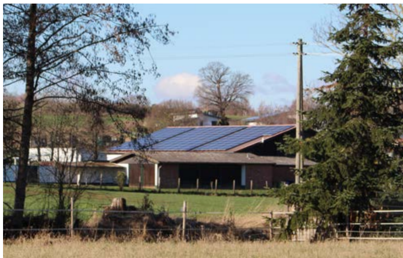
Bild: Die Schützenbruderschaft hat die Dachfläche an einen Investor vermietet.

Davon seien 15 Bambinischützen und 20 Schüler- und Jungschützen. Wir gehen durch einen großen Thekenbereich mit