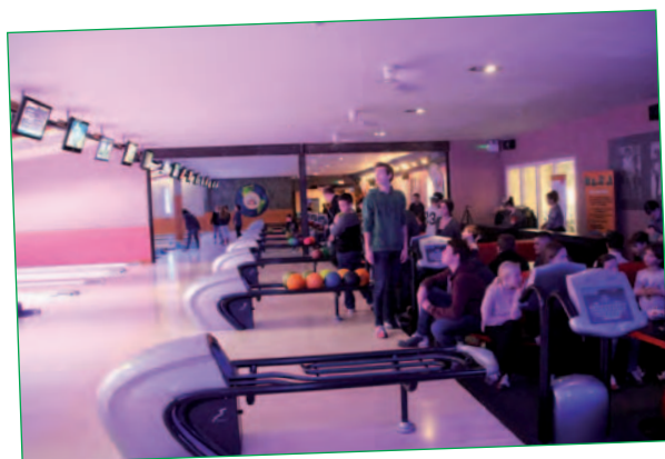
Bild: Auch beim Event in Mönchengladbach hatten die Teilnehmer viel Spaß.

Bild, rechts: Stoppi war beim Bowlen nicht zu bremsen.