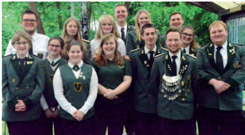
Bild: 50 Jahre Jungschützen Morsbach

2008 konnten wir erfolgreich den DJT (Di-JuTA) ausrichten. Die Teilnahme an den DJT und BJT sind für uns keine Pflichtbesuche, sondern eine Förderung der Gemeinschaft. Bis hin zur Bundesebene sind wir bekannt und aus den verschiedenen Meisterschaften nicht mehr weg zu denken. Nicht nur das Traditionsschiessen und der Schießsport stehen bei uns ganz oben, sondern auch das Fahnen-schwenken. Neue Ideen und Konzepte wurden